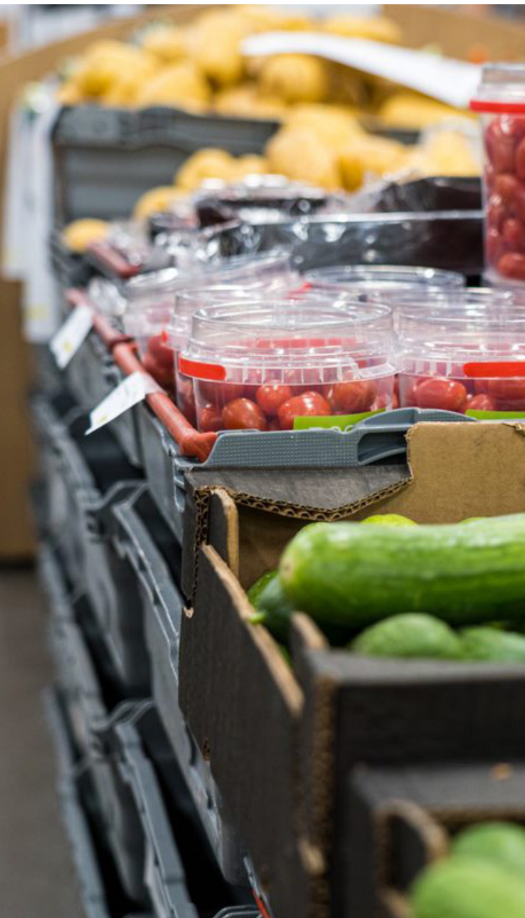
Donerad frukt och grönsaker.