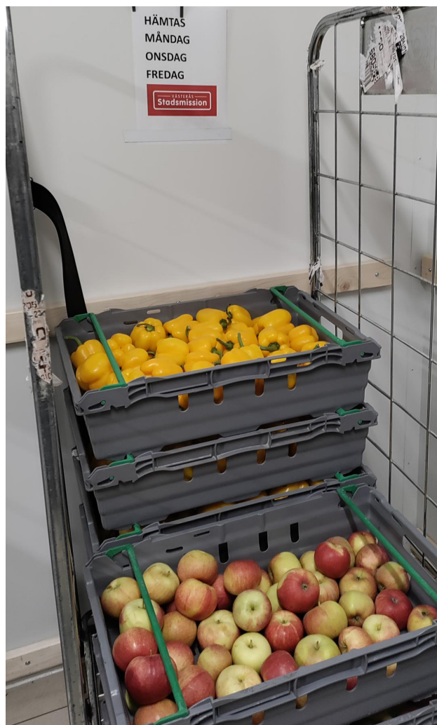
Butikskyl med tydligt uppmärkt plats för var donationer ska placeras samt hämtningsdagar.

Vissa butiker använder en dedikerad svinnkod vid registrering för produkter som doneras och erbjuder svinnlistor för dokumenterad spårbarhet. Att använda en dedikerad svinnkod ger även butiken bra möjligheter att följa upp sitt hållbarhetsarbete.