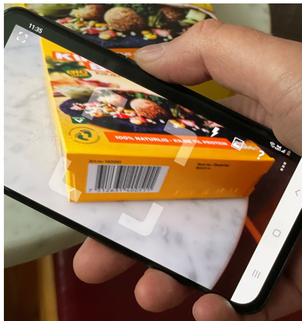
Stadsmissionens matcentraler jobbar med digital produktregistrering.

Avtala med butiken vad som funkar bäst. Ibland