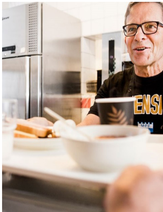
Lunch serveras på Café David, Skåne Stadsmissions öppna mötesplats för män och kvinnor i utsatthet. Maten är till stor del lagad av donerade livsmedel.

Att köpa in eller utveckla stödsystem kan vara kostsamt, men är nödvändigt i stora matbanker.