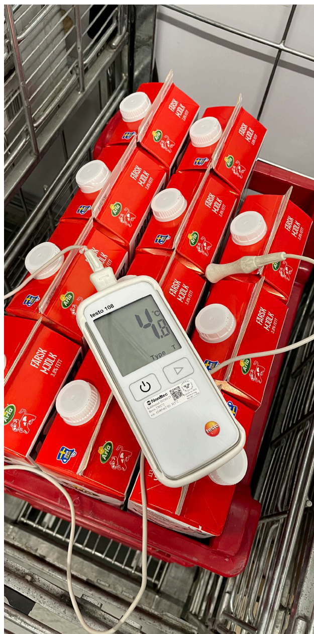
Det är viktigt att kylvaror förvaras i rätt temperatur så att ingen blir sjuk av den donerade maten.

Verksamheten ska även göra en faroanalys, kallad