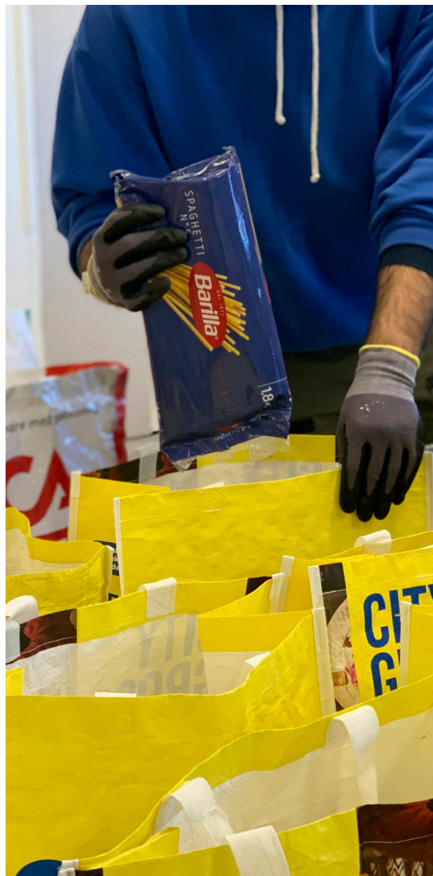
Matkassar packas i Uppsala Stadsmissions matcentral.

Personer inom social verksamhet har inte nödvändigt vis rätt kompetens eller erfarenheter